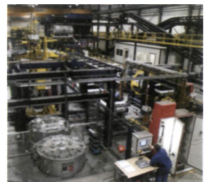
Seiatsu EFA-SD5 combinatie met MPS.

LIOF is aandeelhouder van Eurotech Group BV en heeft een belang van 30% in deze Venlose onderneming.